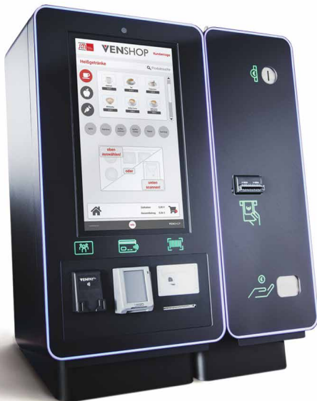
Cashless-Modul + Zusatzmodul (cash)

Dieser ermöglicht als zentrales Zahlungssystem für den gesamten Shop, inklusive aller Automaten, sowohl bargeldlose Zahlungen aller Art als auch auf Wunsch Zahlungen mit Bargeld.